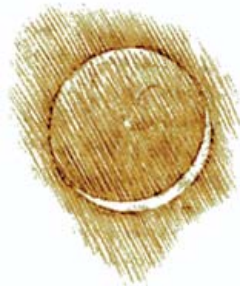
Leonardo da Vinci's tegning af Månen, fra ca. 1506. Jordskinnets er gengivet.

Sollyset på Månen (dvs. måneskinnet) er omtrent 10.000 gange stærkere end jordskinnets, og det udgør det største praktiske problem for observationer, hvor man vil måle de to typers relative størrelse. Forholdet er mindst ved nymåne og observationer er derfor nemmest nær denne månefase. For at udføre en relativ måling af jordskin og måneskin, udvælger man faste områder på Månen – f.eks. krateret Grimaldi i den ene side og "havet" Crisium i den anden side. Disse to områder skal så befinde sig i forskellig belysning – det ene i jordskin og det andet i måneskin – og dette sætter en praktisk grænse for, hvornår man kan lave observationer inden for en Månecyklus. I praksis kan man observere, når Månen er imellem 20 og 80 % belyst af Solen.