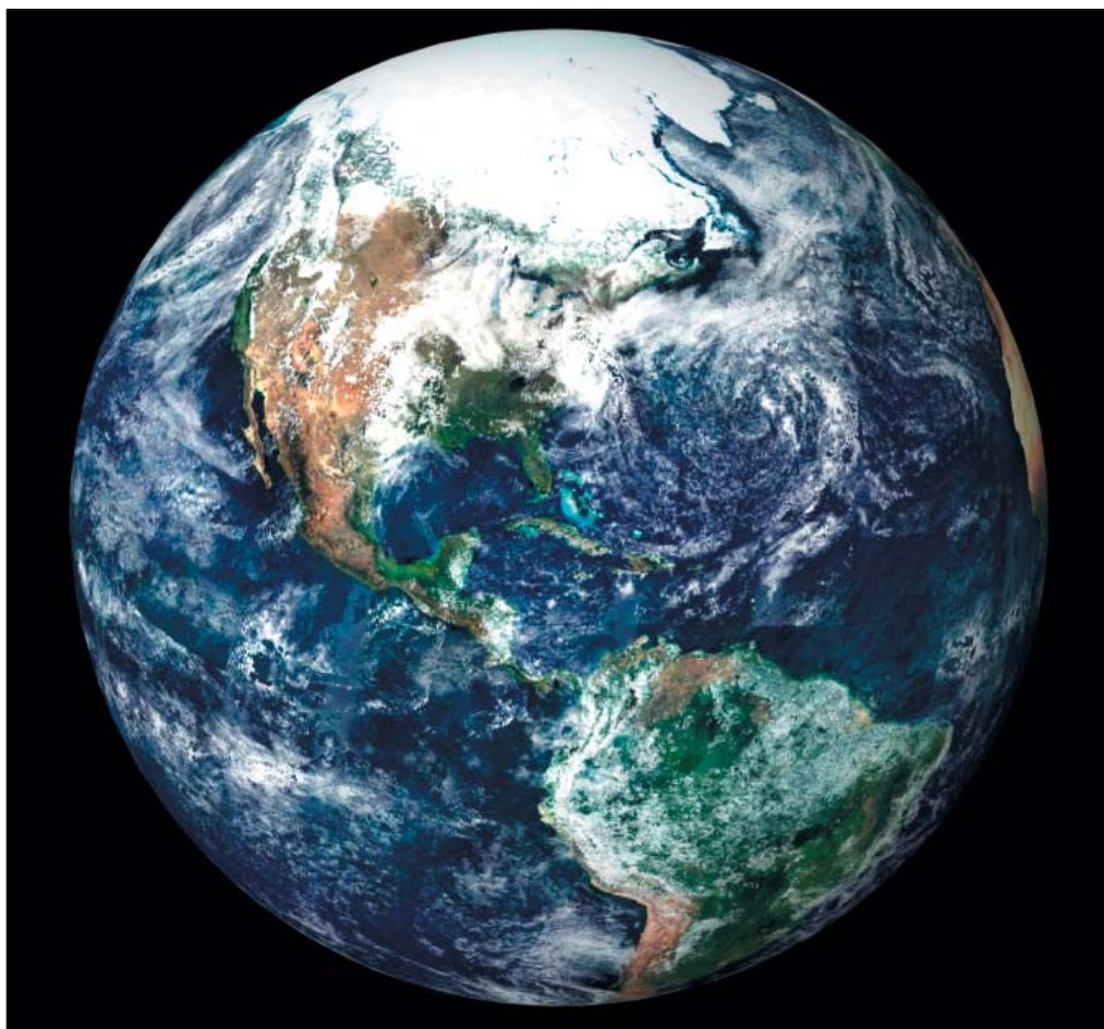
Jordens overflade har varieret albedo. Arktisk is og skyer er hvide, ørkener er lyse og skovene er mørke. Mørkest er havet, hvor en stor del af strålingen fra solen optages. Se også faktaboksen om albedo.

Jordens reflektivitet kaldes i fagsproget også for albedo , der er defineret som forholdet mellem tilbagekastet og modtaget stråling. Jordens albedo afhænger af mængden af skyer (fordi de er hvide, ligesom is og sne), af for-