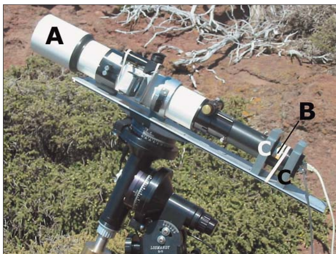
Vores test-instrument testes ved det Nordiske Optiske Teleskop (kuplen bagved) på La Palma, maj 2004. Det automatiske teleskop (i forgrunden) er en 12 cm refraktor med 600 mm brændvidde.